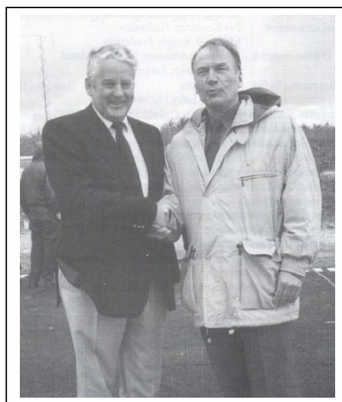
Invielse af den nye motorvej 8 sept. 1997 Rud Nielsen og trafikminister Bjørn West.

Bramming kommune købte af kommissionen 12 hektar til vandindvinding, så kommunens borgere er sikret godt vand langt ind i fremtiden. Vi overlader trygt fremtiden til at bedømme vores indsats, som bevidst er gjort til gavn for borgerne og kommunen.