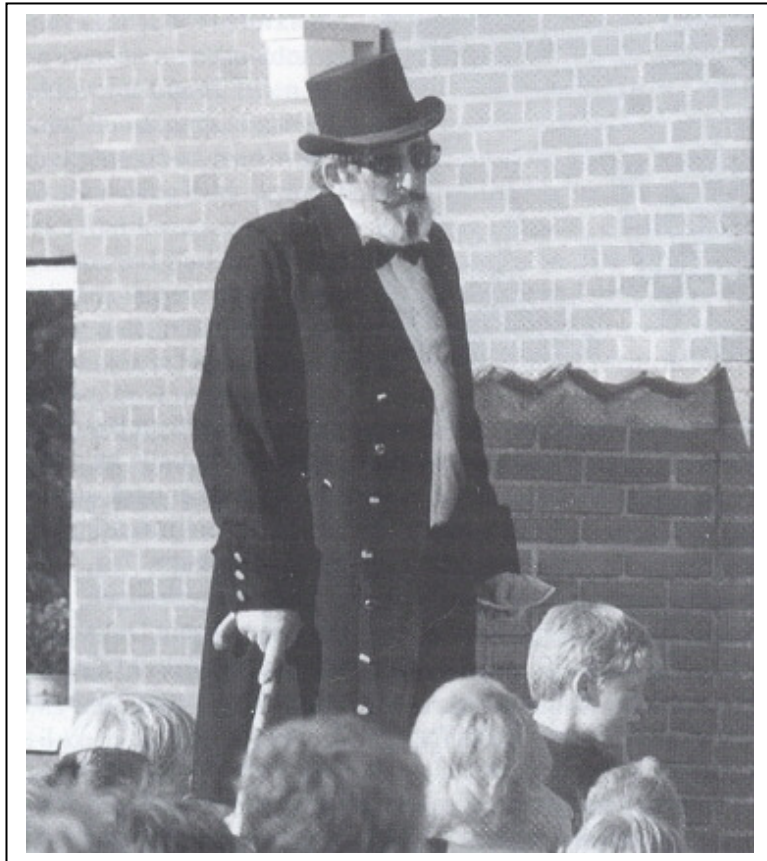
Fra en emneuge med cirkus/gøgl på Vejrup skole i 80erne.