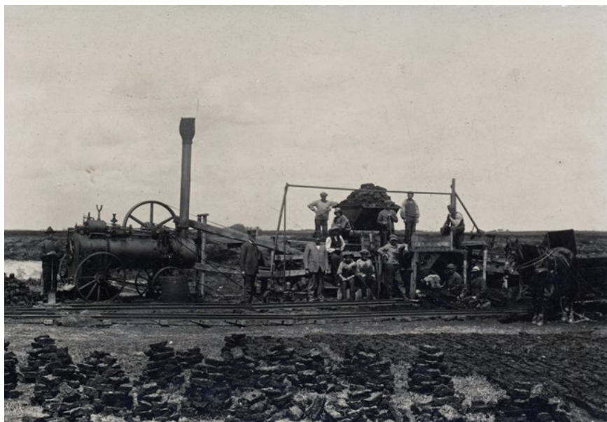
”Damplokomobil” i arbejde i Koldmosen i Aastrup sogn.