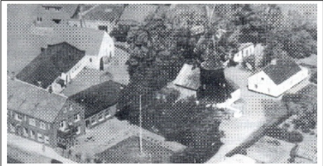
Vejrup Mølle efter der var monteret mindre metalvinger i 1926