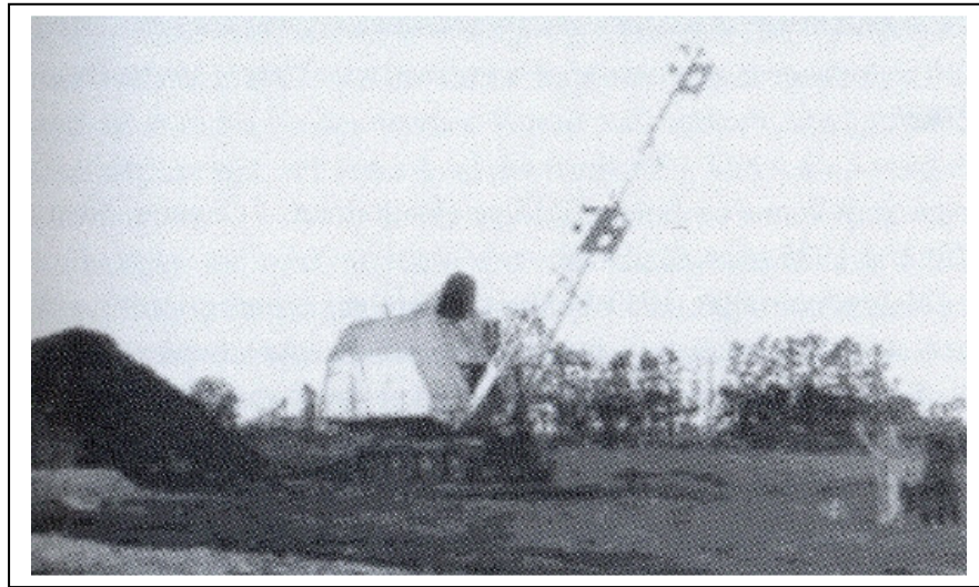
Stor kran fra Nr. Vejrup mergelleje dec. 1960