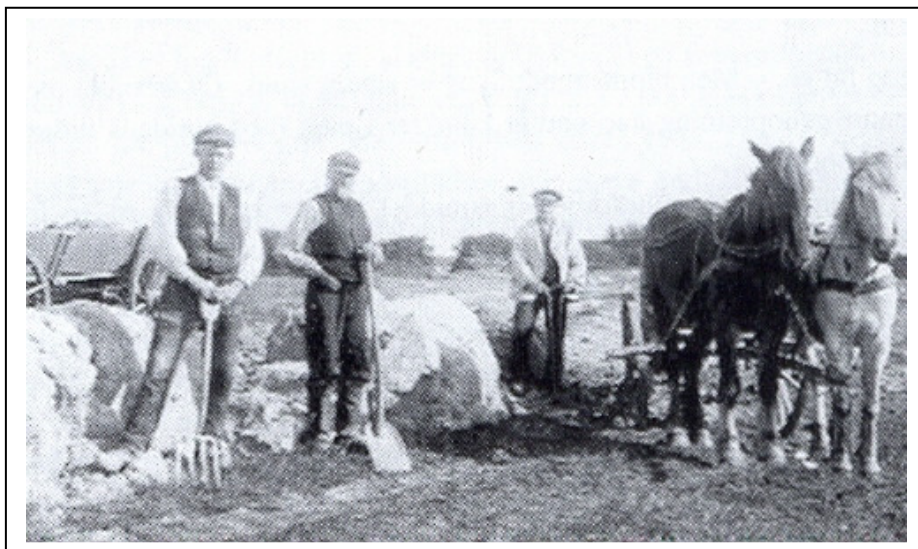
Fra Mergellejet i Bækmark ca. 1948

Det skrev H.C. Andersen i 1859 og det er da tankevækkende hvordan tiden forandrer sig og synet på tingene og dog så lidt. At blomstrende lyng er smuk, vil de færreste vist bestride, men der også dem der synes at et frodigt kulturlandskab er smukt. Blandt dem var jo på den tid Erinco Dalgas, der tog fat på opdyrkingen af heden med ildhu. Hvis man spørger folk i dag, om lyngheden var den oprindelige naturlige tilstand, så vil mange jo nok svare ja, men i virkeligheden var lyngheden et kulturlandskab skabt af vore forfædre ved svejdebrug, - afbrænding af skov for at skaffe god agerjord, som de dyrkede indtil den var så udpint, at det netop kun var lyngen der kunne gro, hvorefter man tog et nyt stykke skov. Derfor kan man med god ret sige, at det var et stort naturgenopretningsprojekt Dalgas tog fat på. Men blomstrende lyng er jo stadig smuk og arbejdet med naturgenopretning har ændret karakter i pagt med nutidens ønsker og behov.