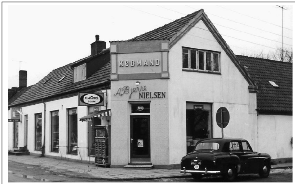
Købmandsgården, med udendørs automat. Først i tresserne. Arkivfoto

Tiderne skifter, der kommer nye salgsmetoder og hen ad vejen moderniserede vi, væltede vægge og indsatte nyt inventar. Mange skuffer forsvandt, der kom nu flere færdig-pakkede varer og helt andre dukkede frem på hylderne.