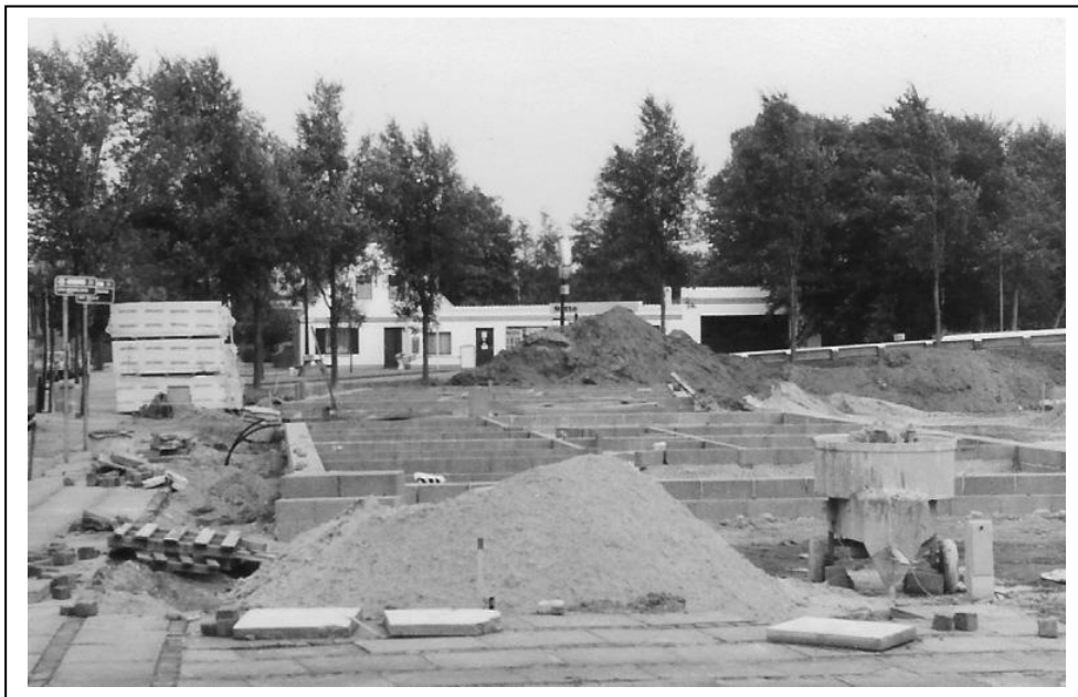
I 1988 gjorde bygningerne plads for nye pensionistboliger.

En epoke er slut, Købmandsgården bestod i næsten 100 år og vi har mange dejlige år at tænke tilbage på.